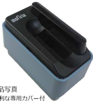
FVA-U4ST製品写真 持ち運びにも便利な専用カバー付