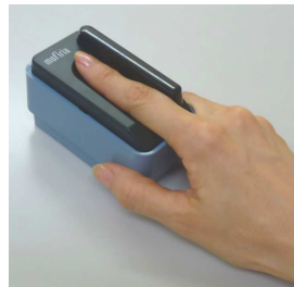
指置きイメージ 底面にはゴム足付でしっかり固定